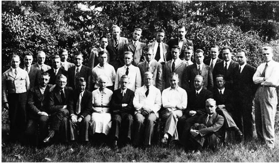
Vijfde en laatste jaargroep op Finkenwalde, 1937, Bonhoeffer middenvoor

kerngezag uit de Lutherse traditie gewijzigd van dit origineel: