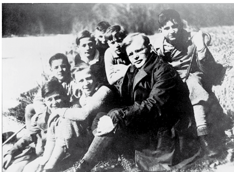
Bonhoeffer met een jongerengroep in 1932

dat zijn onderdak vond op het landgoed Finkenwalde, bij Stettin. Dat seminarie gaf hij vorm als een interne gemeenschap, waar de studenten met elkaar leefden, studeerden en de liturgie vierden. Hij schreef het boek Nachfolge en uit zijn ervaringen met de studenten hier verscheen in 1938 Gemeinsames Leben , over het gemeenschappelijke leven, het thema waar hij destijds op promoveerde. Tegelijkertijd, wanneer het de Bekennende Kirche al aan kracht begint te ontbreken, kwam hij, net als enkele van zijn broers en zwagers, in contact met het verzet.