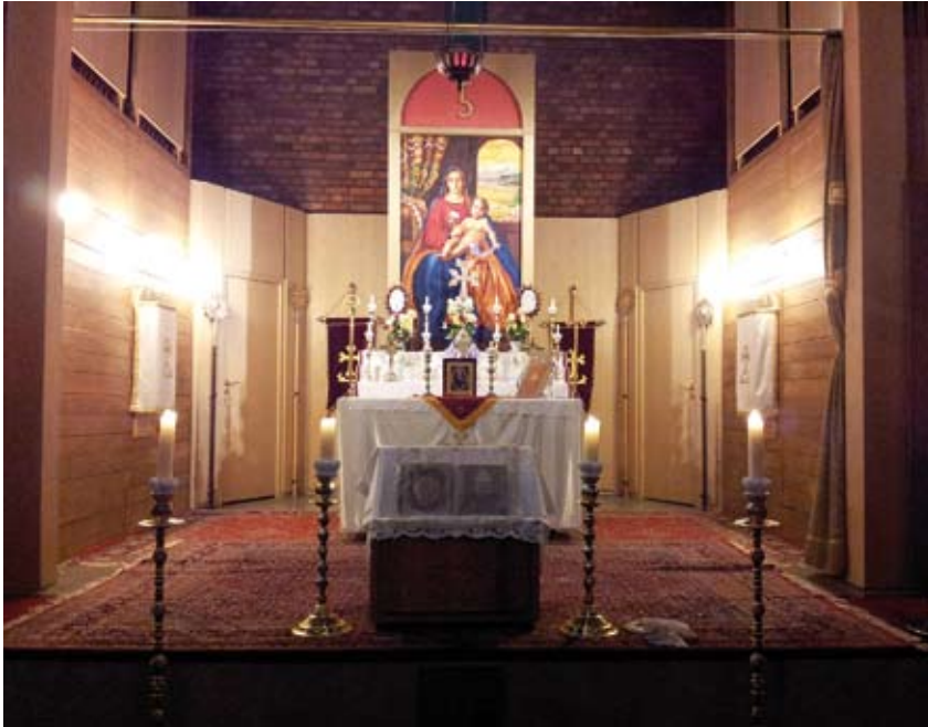
Afbeelding 2: Armeense kerk in Keulen