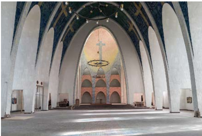
Afbeelding 7: Heilig Kreuz Kirche in Gelsenkirchen.