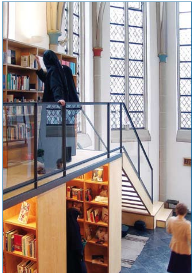
Afbeelding 5: Chorus Buchhandlung in Kempen (D). Foto: Dewey + Blohm-Schröder Architekten