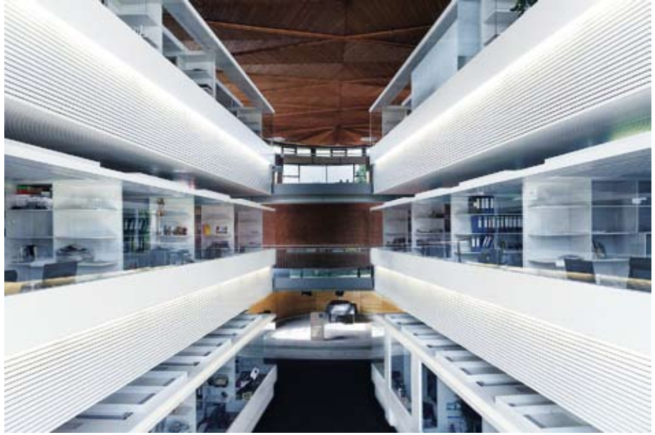
Afbeelding 6: Uitgeverij 'Dialog Verlag' in de voormalige Bonifatiuskerke in Münster.