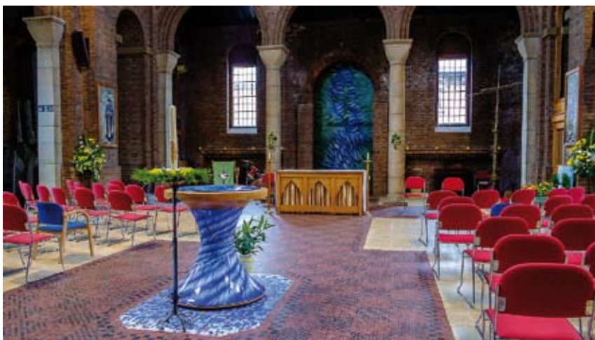
St. Cuthbert's Copnor, foto: Diocese of Portsmouth

Dit is waarlijk een spiritueel huis. Niet alleen het derde deel dat aan de eredienst is gewijd, maar het hele complex met gemeenschapsfaciliteiten, de dokterspraktijk en haar mensen maken het tot een spiritueel geheel. 2