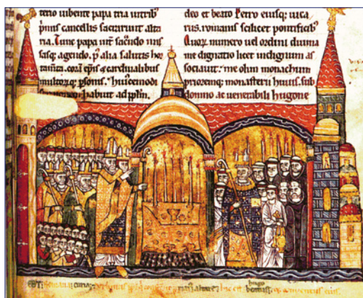
De wijding van ‘Cluny III’ door Urbanus II (Odon van Cluny, twaalfde eeuw)