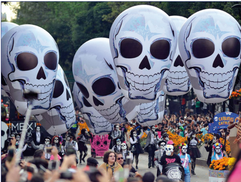
1 ‘Dia de los muertos’-parade in Mexico-City (The Independent, 2017)

‘Wat de doden betreft: daar de Schrift ons hierover niet informeert, beschouw ik het niet als een zonde om vrij en devoot zoiets te bidden als: ‘Goede God, als deze ziel zich in een staat bevindt waarin toegang tot genade is, wees Gij dan ruimhartig.’ En als dit dan één of twee keer gebeurd is, laat het dan genoeg zijn. Want vigilies en requiemmissen en jaarlijkse vieringen van requiems zijn nutteloos, en weinig anders dan de jaarmarkt van de duivel.’ 1