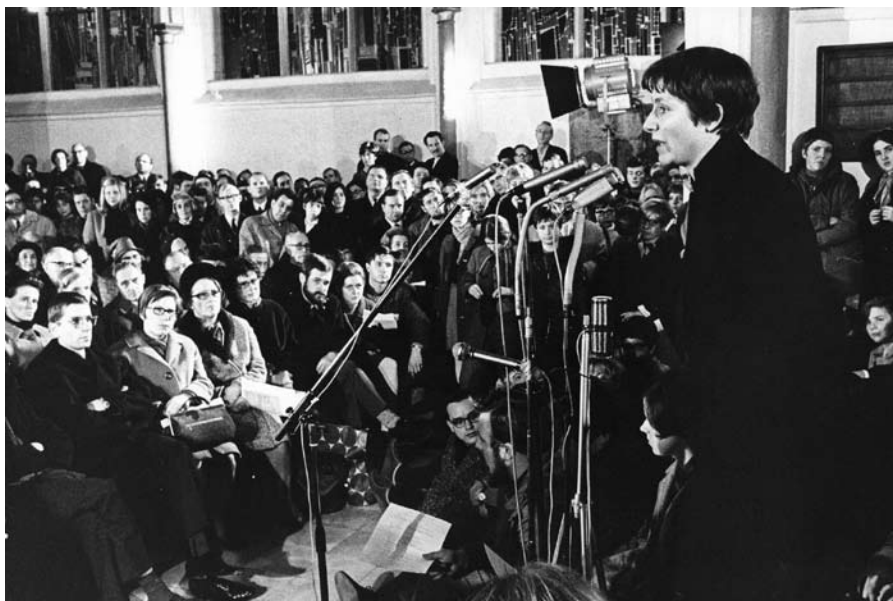
Theoloog Dorothee Sölle spreekt tijdens het Politisches Nachtgebet in de Anthoniterkirche in Keulen (1969).

Naast dit aanpassingswerk komt er ruimte én oog voor nieuwe, plaatselijke vormen. Her en der, beginnend in de steden van West- en Zuid-Duitsland, ontstaan allerlei nieuwe ex-