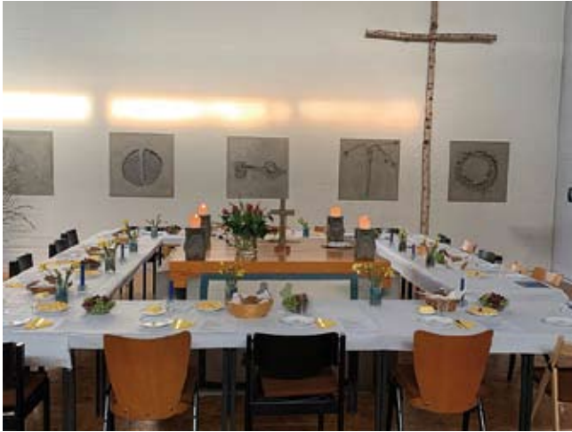
Feierabendmahl op Witte Donderdag 2018 in de Evang. Kirchengemeinde Einhausen.